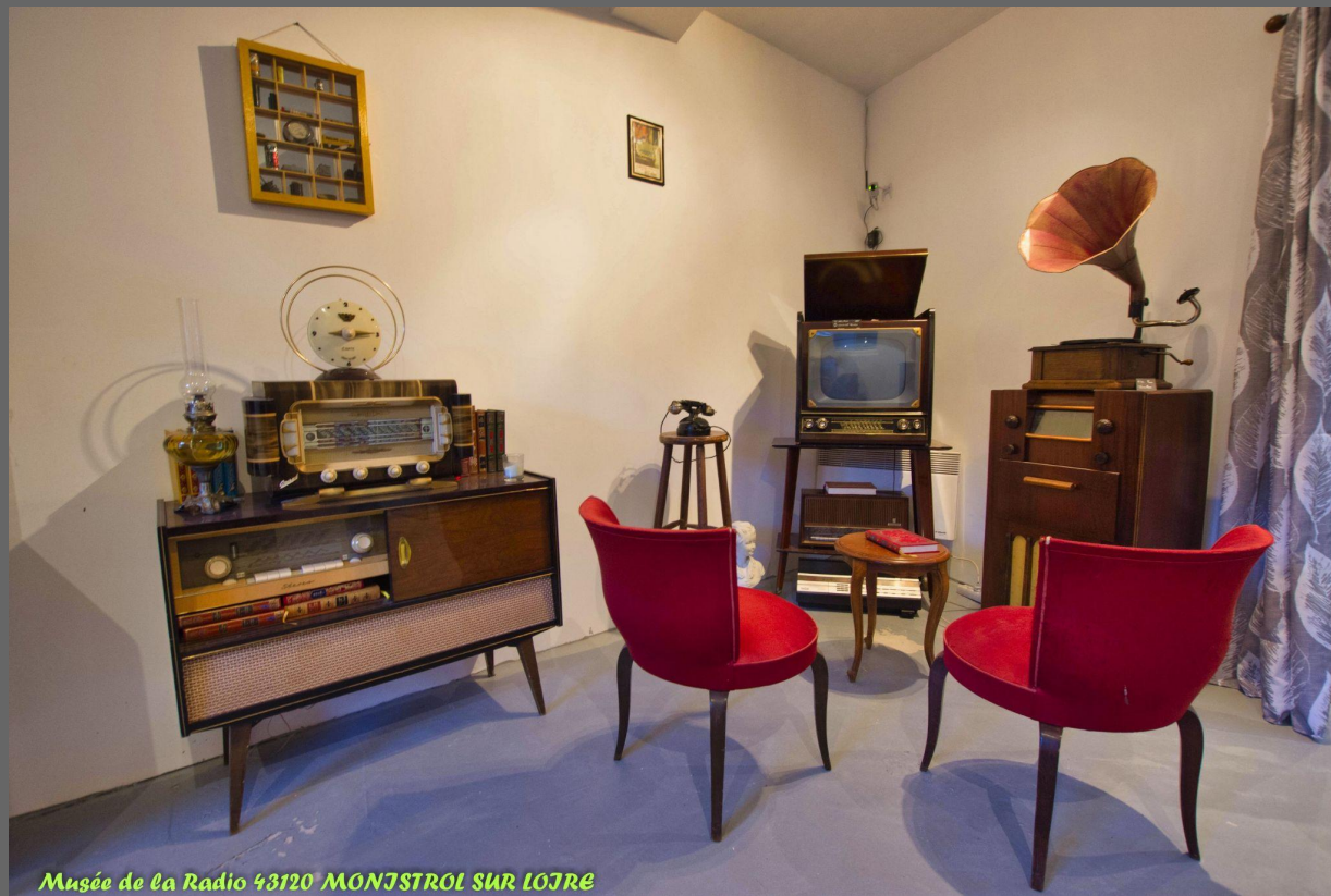
Musée de la Radio 43120 MONESTROL SUR LOJRE

Le musée de la radio propose plusieurs collections issues de la région Auvergne Rhône Alpes. Des postes TSF de 1920 à 1990, des appareils de communications, mais aussi des gramophones, électrophones et platines vinyles.