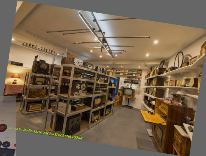
Musée de la Radio 93720 MONJSTROL SUR LOIRE

Nous vous proposons 4 salles d'expositions La salle TSF La salle dédiée à l'univers du disque La salle sur le thème des communications La salle pour les expositions temporaires