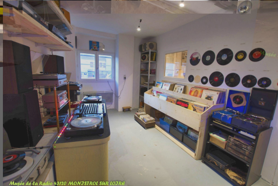
Musée de la Radio 93720 MONJSTROL SUR LOIRE