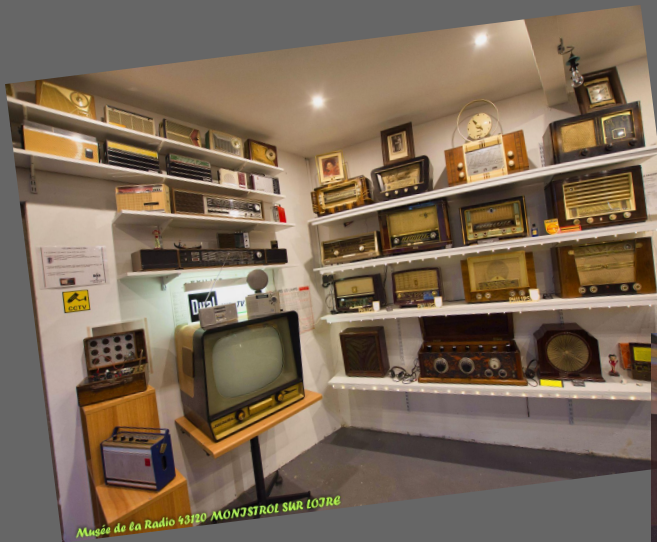
Musée de la Radio 93720 MONJSTROL SUR LOIRE